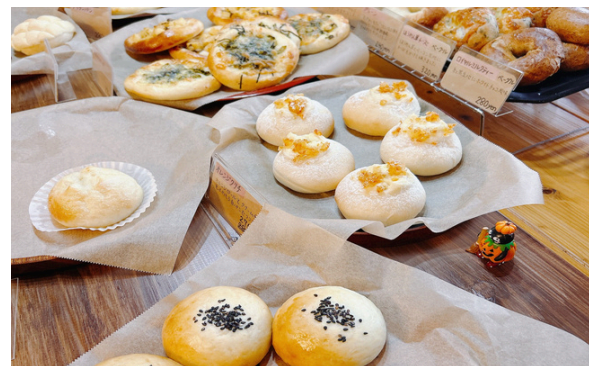
店内には美味しそうなパンが並ぶ。つぶあんの「あんこパン」は自慢の人気商品。

土幌でも保育士として就職し、そのまま8年の年月が経過。順調な毎日でしたが、大病を患い、長期療養を余儀なくされます。「健康に生きる」「娘に格好いい姿を見せる」という思いを強く抱くようになり、パン作りが趣味だったことから、ご両親の自宅横の物置を自ら改築し、パン屋を開業します。町の人気店として、充実した日々を過ごされています。