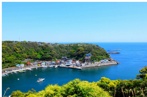
小説『伊豆の踊子』にも登場する「波浮港」ノスタルジックな風情ある漁港。

綺麗な海と雄大な自然に囲まれて、こどもにはこれ以上ない最高の環境で育ちます。特産品のくさやは、現在も取り寄せるほど大好きで、「くさやキャンプ」を行うほど。 大好きな離島生活でしたが、母親の実家が本土にあったこともあり、短大進学を機に自然と本土へ。新たな生活がスタートします。