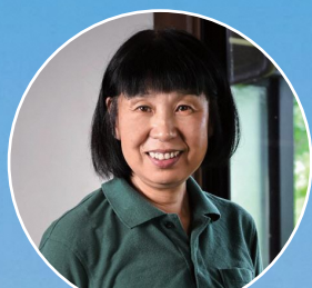
ファシリテーター