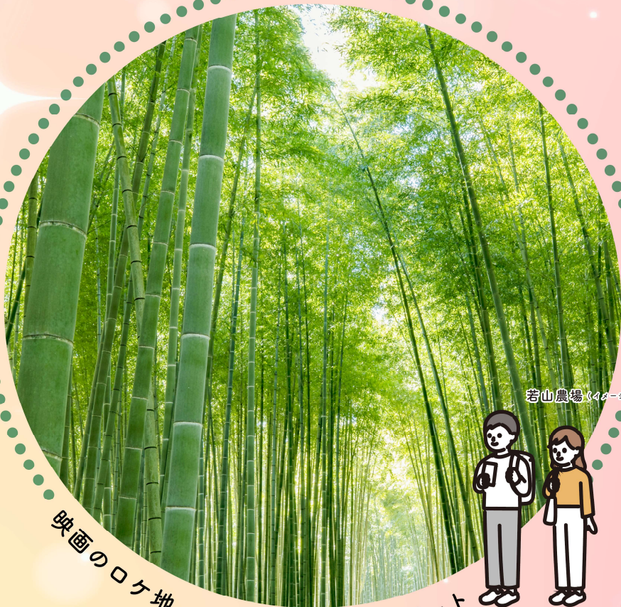
若山農場 (イメージ)