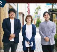
沿岸ブース (気仙沼市、南三陸町、東松島市、石巻市)