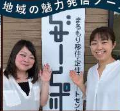
県南ブース (七ヶ宿町、柴田町、川崎町、山元町、丸森町)