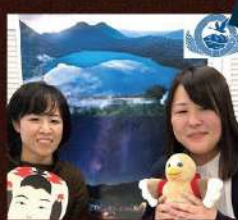
県北ブース (色麻町、加美町、涌谷町、美里町、栗原市、登米市、大崎市)