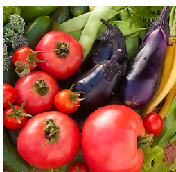
東川の水で育った作物