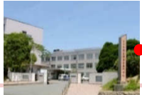
宇部工業高等専門学校