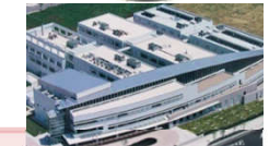
山口県産業技術センター