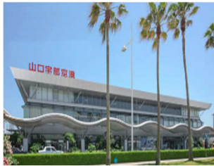
東京 - 宇部 90分 空港から市街地へ クルマで10分

※市が確保した市内のオフィスを、お試しオフィスとして一定期間、無料で使用することができます。