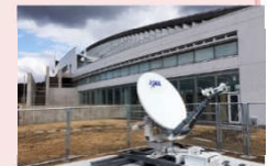
JAXA西日本衛星 防災利用センター