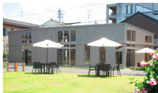
うべ産業共創イノベーションセンター 志 (5G実証環境整備予定)