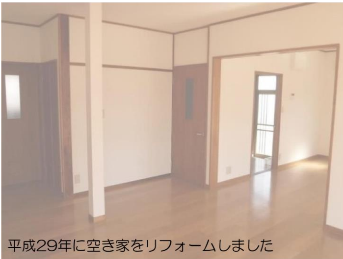
平成29年に空き家をリフォームしました