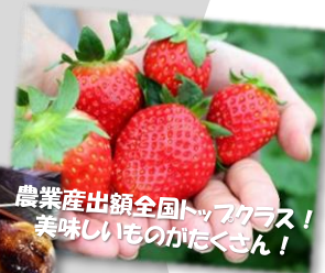
農業産出額全国トップクラス! 美味しいものがたくさん!