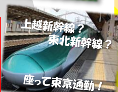
上越新幹線? 東北新幹線?