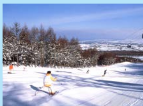
盛んなウインタースポーツ