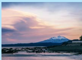
日本海から望む岩木山