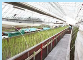
冬の農業（アスパラガス）