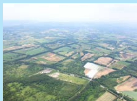
豊かな実りを生む津軽平野