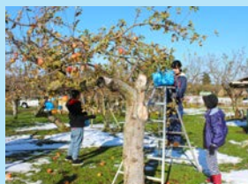
冬を前にりんごの収穫