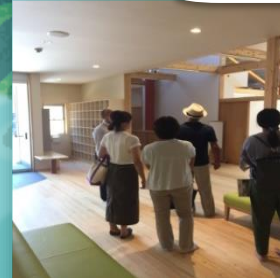
(ふれ愛ベースイメージ)