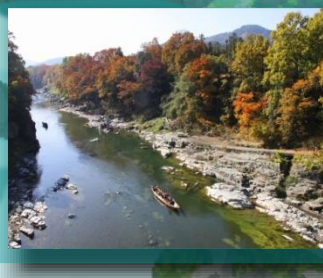
(長瀬紅葉イメージ)