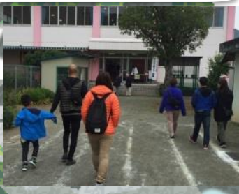
(学校訪問視察イメージ)