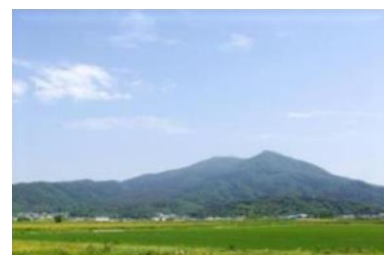
登山でリフレッシュ(車で約60分)