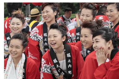
地域の風習を伝えています(大助祭り)