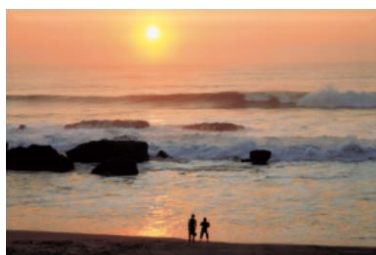
海水浴も初日の出も(車で約30分)