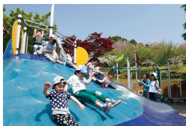
親子で遊べる公園がたくさん！(静峰ふるさと公園)