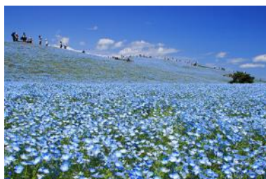
「人生で一度は見たい絶景」を何度でも(車で約30分)