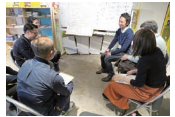
※昨年のリアルトークイベントの様子