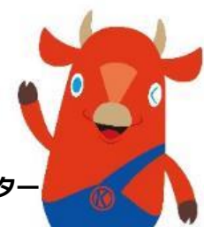
木古内町公式キャラクターキーコ