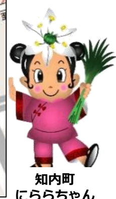
知内町にららちゃん