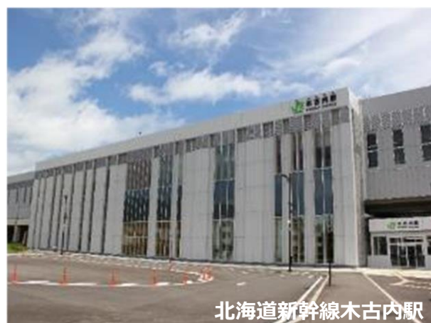
北海道新幹線木古内駅