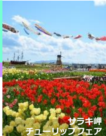
サラキ岬チューリップフェア