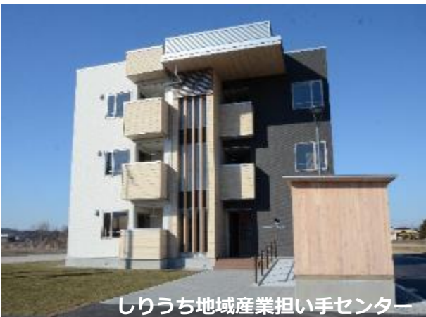
しりうち地域産業担い手センター

あずましいとは… 北海道弁で、「居心地がいい」「落ち着く」という意味。 漢字で書くと「吾妻しい」。 「我が妻がそばにいるような居心地のよさ、安心感」が語源です。