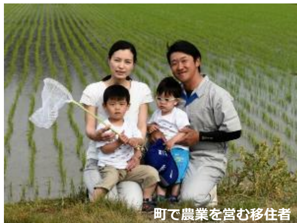
町で農業を営む移住者