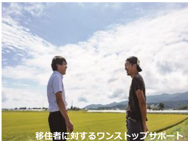
移住者に対するワンストップサポート