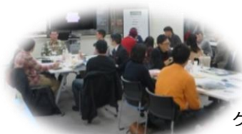
ゲストとの本音トーク(座談会)