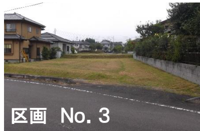
区画 No. 3