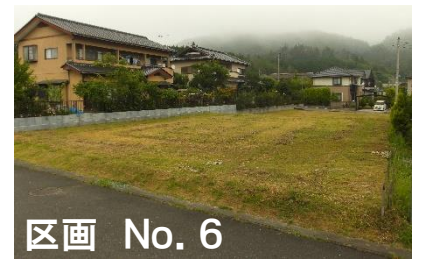
区画 No. 6