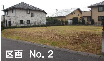
区画 No. 2