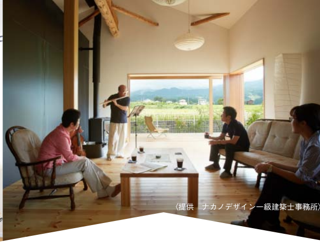
(提供 ナカノデザイン一級建築士事務所)