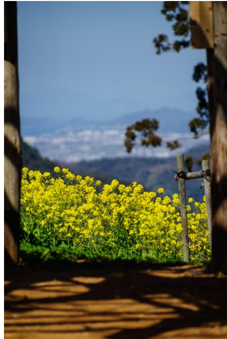
みんなが楽しく集まれる場所を目指し、昔みかん畑だった耕作放棄地を再開拓した佐礼谷のシンボルである“黄色い丘”の春の風景